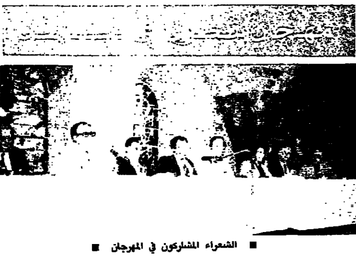
الشهداء المشاركين في المهرجان

ولكنهم في مصر لم ينسوه فاصروا على الرئيس العلم وعلى الجمعية الويسية طابين عونه الى مصر حيث اصبح وكلما بطريركاً ثم طرانا معلونا للبطريرك كيريلس مخفي. ويوم الاثنين السيدوس المقدس بطريركاً كالت ائتمنل تتمه نحو الطران مورا، الا انه بواجب يفرض بثنا رغم التاكيد مراراً بوجوب القول. وهكذا انتخب البطريرك كيريلس كيريلس بموجب الجمعية الويسية المقدس بسبب تواضع الطران مورا. الا انه لم ينس الجمعية الويسية التي كان منتقيا اليها وكان يرى ان لا يفي فيها ايامه الاخيرة الا ان منحه في اخر سنواته منعت من السفر. الا انه كان يوما يسألني عند زيارتي لمصر عن حالة الجمعية ويفرح لتقدمها وازدهارها. اما الطران باسيلوس خوري فلم يات الى هنا بل ذهب الى الجنوب اللبناني الذي تحن الى لبنان وهو ان في مدمية الكبرى. انما لا ناس ولا قطع الاصل بان يعود الحق الى صيده قريبا وقريبا جدا وربما اكثر مما نحن نتصور. ذهب الى دير المخلص الذي نسيه الدير العلم. والذي اصبح الآن لا اقرب في حرب. بل اصبح في دير غير الرعيان الذين تقوا في طيلة 300 عام.